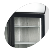
Внутренняя вертикальная подсветка